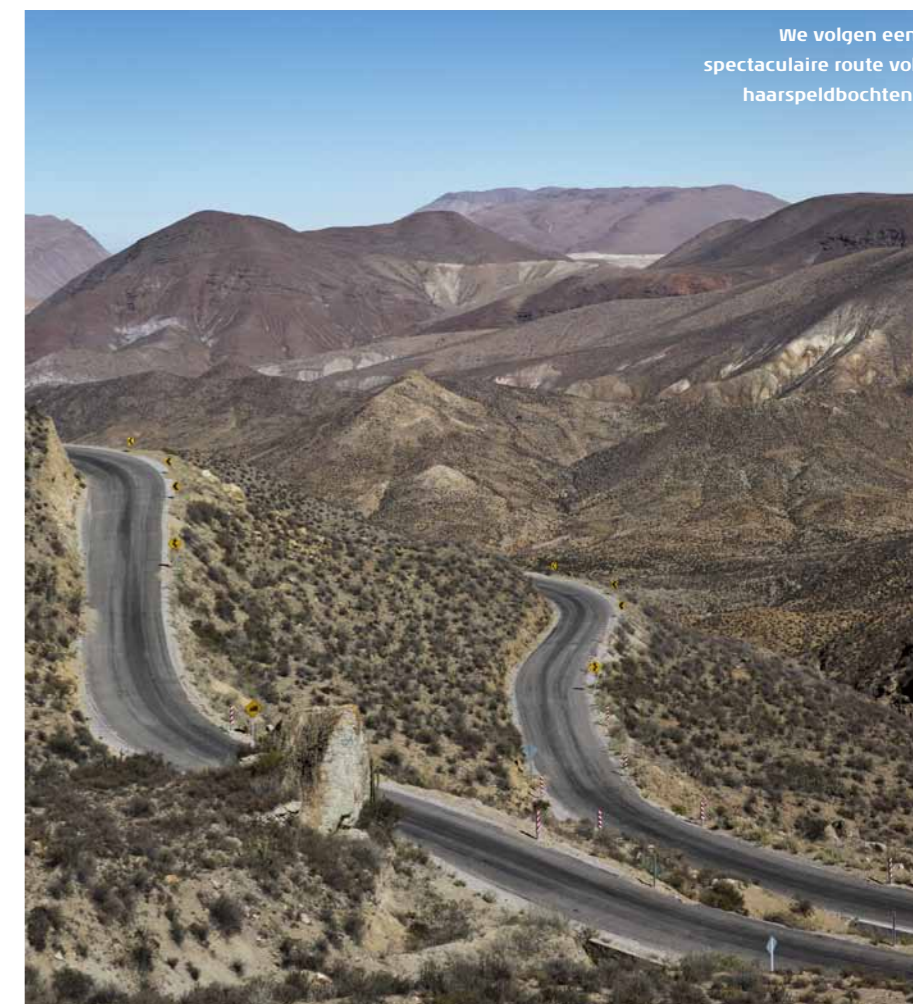
We volgen een spectaculaire route vol haarspeldbochten.

Lauca, maar dit keer slaan we af op een onverharde weg richting het Las Vicuñas reservaat. De naamgevende diersoort is er in grote aantallen aanwezig. Even sierlijk als schuchter springen de vicuñas in grote kuddes door het taaie gras, op een achtergrond van rokende vulkanen en diepe kloven. De weg door het reservaat loopt naar de 113 vierkante kilometer tellende zoutvlakte van Surire. Deze 'salar' staat bekend om zijn flamboyante gevogelte, met name de flamingo en de nandoe. Laatstgenoemde is een soort struisvogel, en maakt de