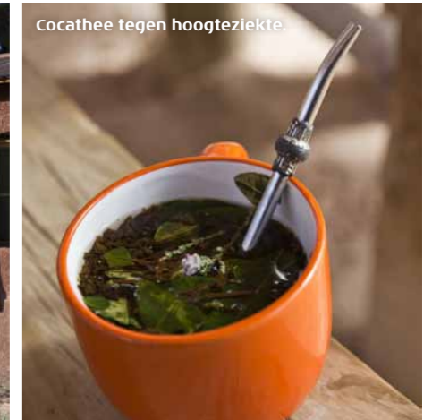
Cocathee tegen hoogteziekte.

omheen te fotograferen valt, een betere naamgever zijn geweest. De besneeuwde reus torent boven het met taaie graspollen gespikkelde hoogvlakte uit. Het ijle landschap eromheen lijkt onder gewicht van de hemel in langgerekte glooiingen te zijn gedrukt. Meestal in honderd tinten beige, maar soms ook verrassend rood, met her en der gele vlekken mos. In drassige, met plakken ijs bedekte dalen bevinden zich groene bofedales ; netwerkes van kleine, kraakheldere stroompjes rondom bulten