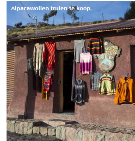
Alpacawollen truien te koop.