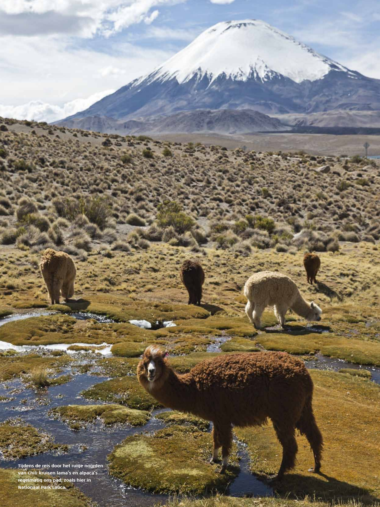
Tijdens de reis door het ruige noorden van Chili kruisen lama's en alpaca's regelmatig ons pad, zoals hier in Nationaal Park Lauca.