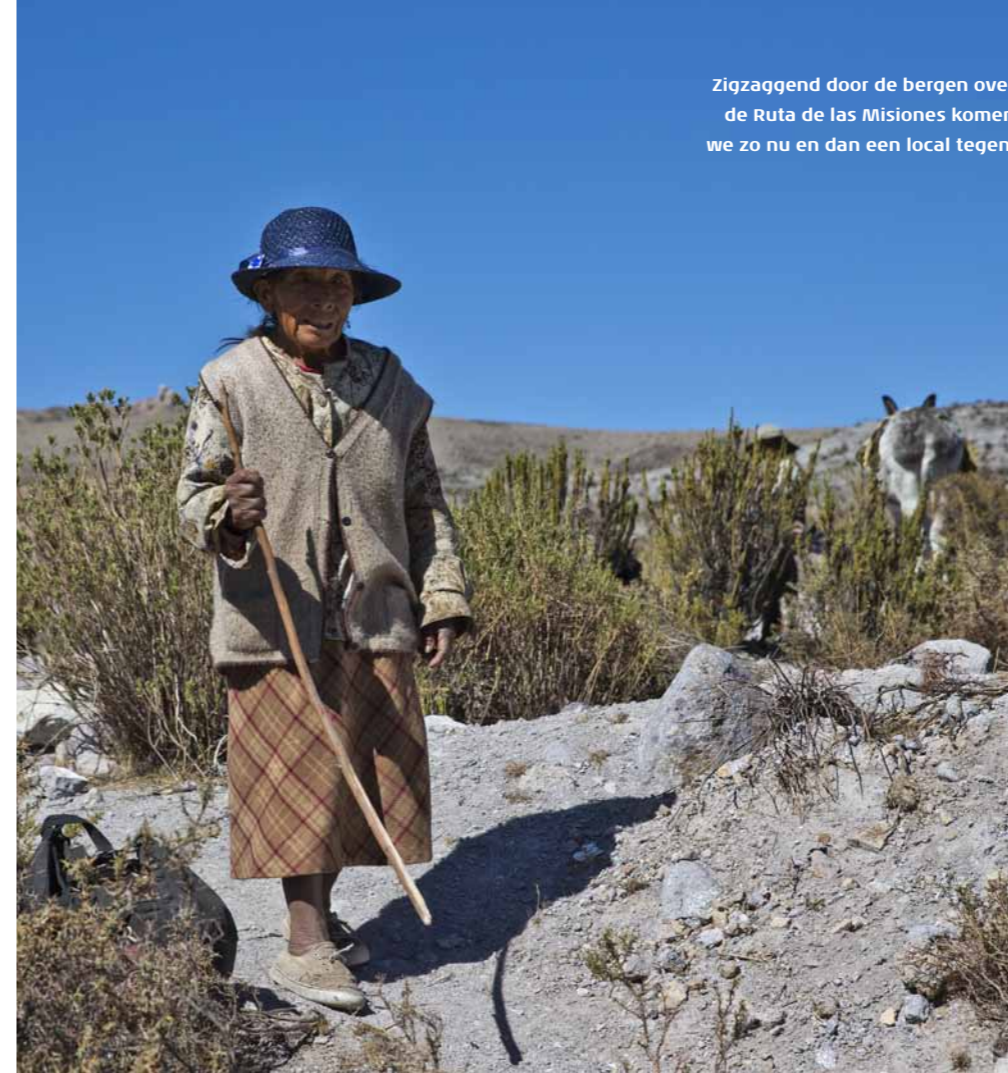
Zigzaggend door de bergen over de Ruta de las Misiones komen we zo nu en dan een local tegen.