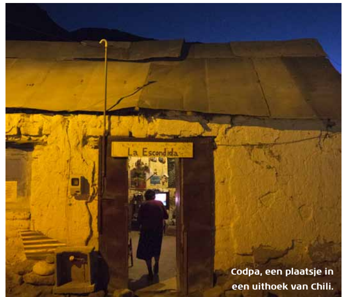
Codpa, een plaatsje in een uithoek van Chili.