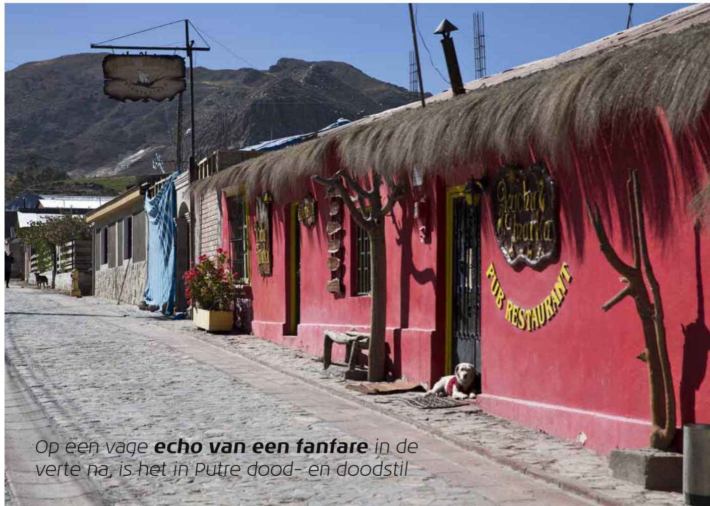
Op een vage echo van een fanfare in de verte na, is het in Putre dood- en doodstil