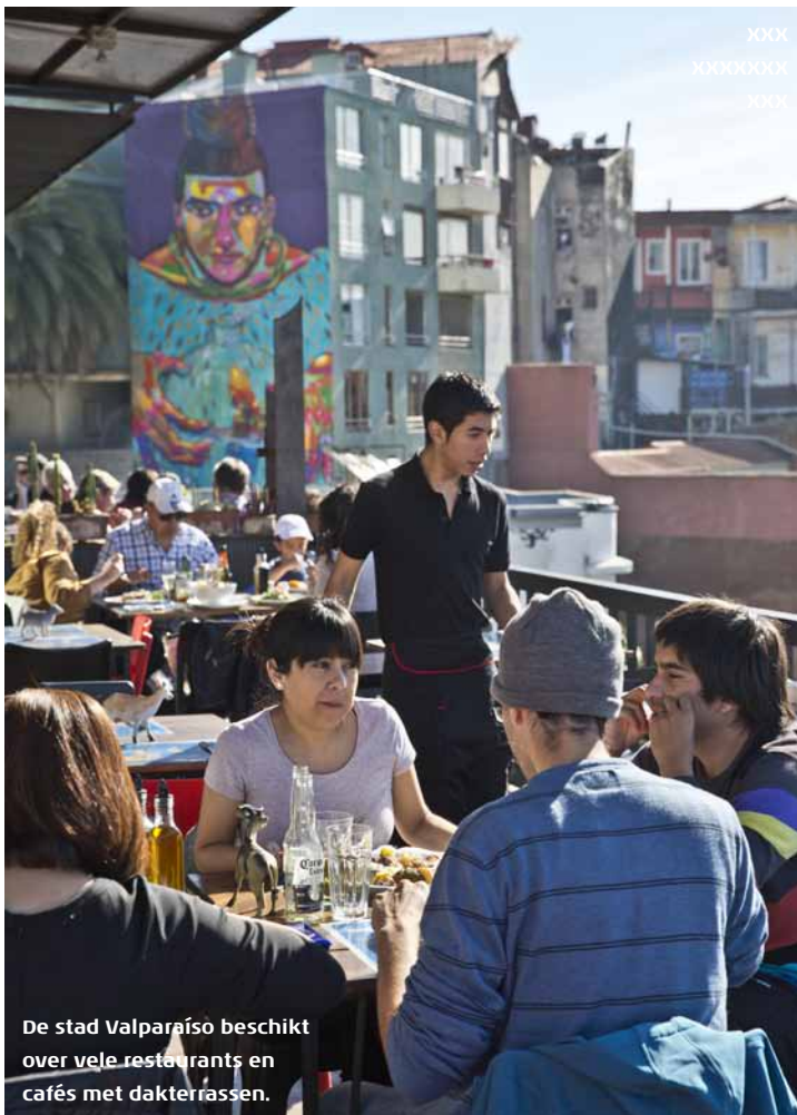
De stad Valparaíso beschikt over vele restaurants en cafés met dakterrassen.