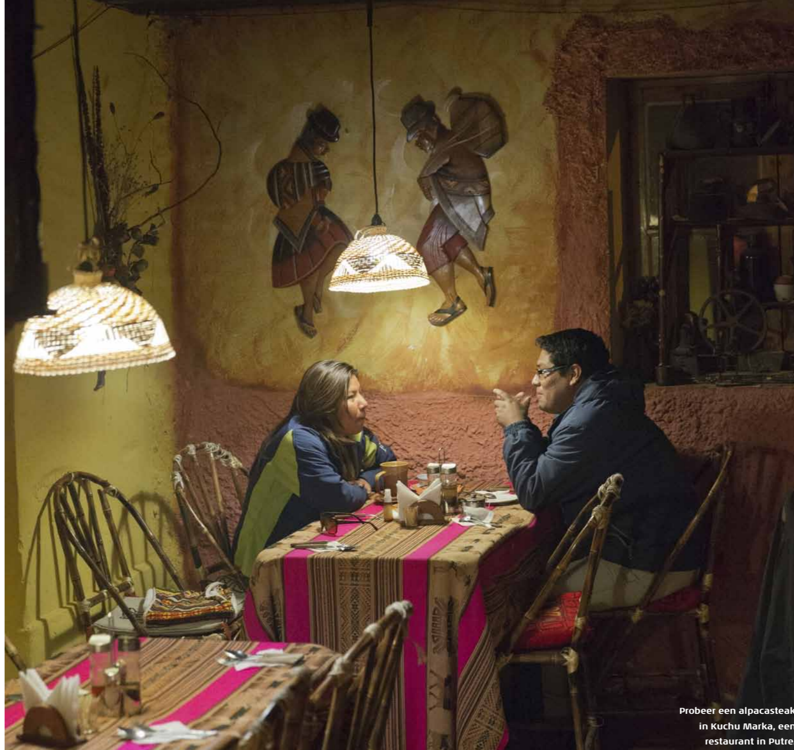
Probeer een alpacasteak in Kuchu Marka, een restaurant in Putre.

HOTEL LE RÉVE, ORREGO LUCO 23, WWW.LEREVE.CL