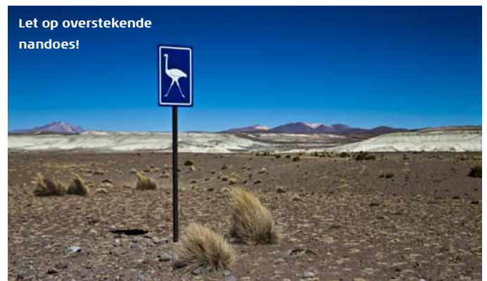
Let op overstekende nandoes!

volle gang om de regio aantrekkelijker te maken voor toerisme. Vooralsnog voelt het echter nog uiterst toeristloos. Dorpjes kondigen zichzelf aan vanaf berghellingen, waar hun namen met rotsblokken staan gespeld. Belén bijvoorbeeld: veel meer dan een verzameling barakken onder stoffige eucalyptussen, rondom een modderkerkje dat ternauwernood drie eeuwen aan aardbevingen heeft doorstaan is het niet. Even voorbij het dorp stoppen we bij een uit rotsen gehakt altaar, dat een ietwat lugubere Mariapop bevat, met eromheen een heleboel kruizen. Er is geen mens, en geen vleugje wind, alleen absolute stilte die slechts een paar minuten wordt doorbroken door het gezoem van een eenzame vlieg.