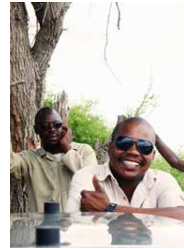
Gidsen van Wilderness Safaris.