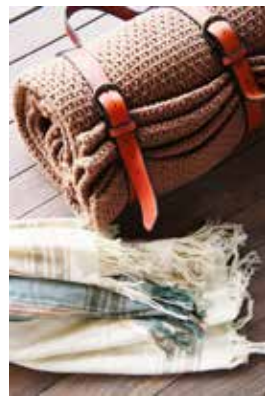
Een deken en daaronder een Kikoy, een traditionele Afrikaanse doek.