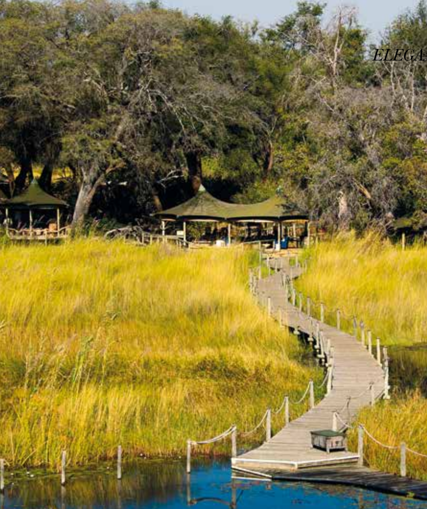
Kamp Vumbura Plains.