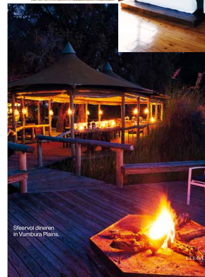
Sfeervol dineren in Vumbura Plains.