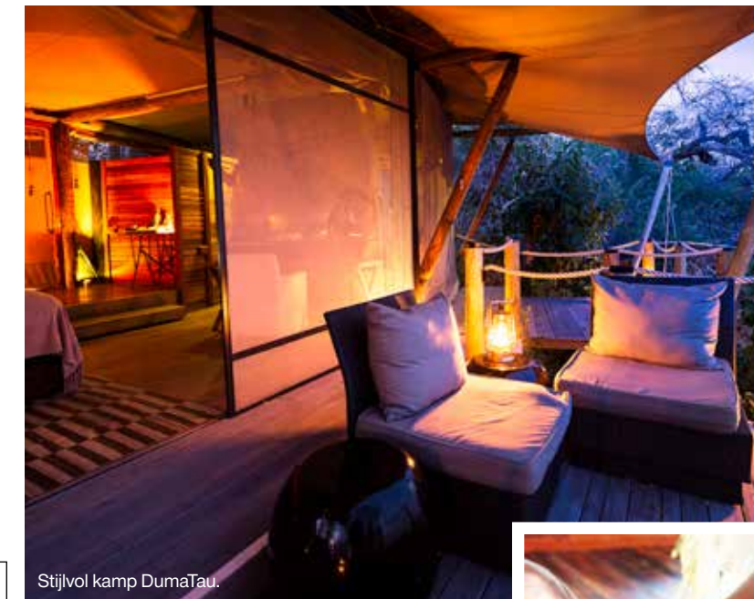
Stijlvol kamp DumaTau.

Het stijlvolle kamp DumaTau ('gebrul van de leeuw') ligt prachtig aan een lagune van de Linyanti-rivier, tegen het noordelijk gelegen Chobe National Park aan. Vanaf Vumbura Plains is het een halfuurtje vliegen. Het is een van de eerste kampen van Wilderness Safaris en het is twee jaar geleden gerenoveerd. Condé Nast Traveller plaatste DumaTau in de Hotlist van 2013; als een van de beste 'nieuw' hotels in de wereld. Het kamp heeft tien luxe canvas safaritenten en draait volledig op zonne-energie. De tenten, met grote bronzen wasbakken, loungestoelen en privéterrassen pal aan het water, worden verbonden door een lange loopbrug. Aan het einde van de loopbrug is een zwembad, iets groter dan een dipping pool . Na een jeepsafari is