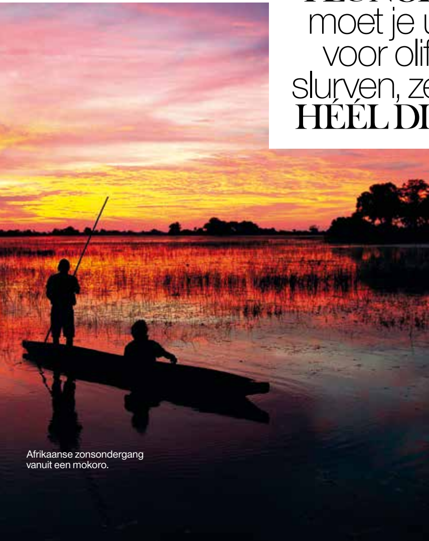
Afrikaanse zonsondergang vanuit een mokoro.