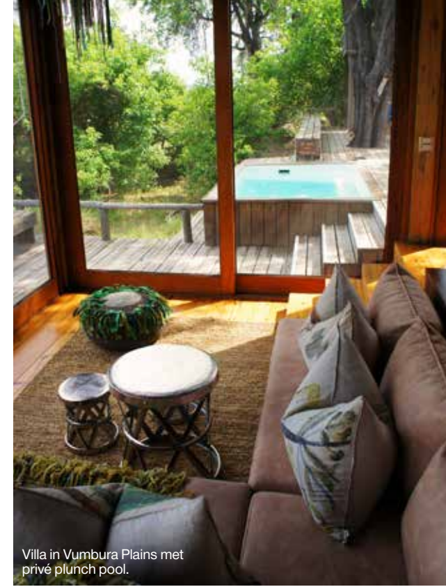
Villa in Vumbura Plains met privé plunge pool.

Botswana heeft over het algemeen een subtropisch klimaat met in het noorden een regenperiode van november tot maart. De delta is het hele jaar door te bezoeken, ieder seizoen heeft zijn voor- en nadelen. Mei t/m september is het droogst en het beste voor safari's, met juli/oktober als internationaal hoogseizoen. Van april tot oktober zijn er koelere dagen en warmere nachten, dit is doorgaans een rustigere periode. In de Nederlandse zomermaanden is het zonnig en is de delta op zijn grootst. De delta is ook heel goed in het regenseizoen te bezoeken; met name voor vogelaars is deze periode interessant.