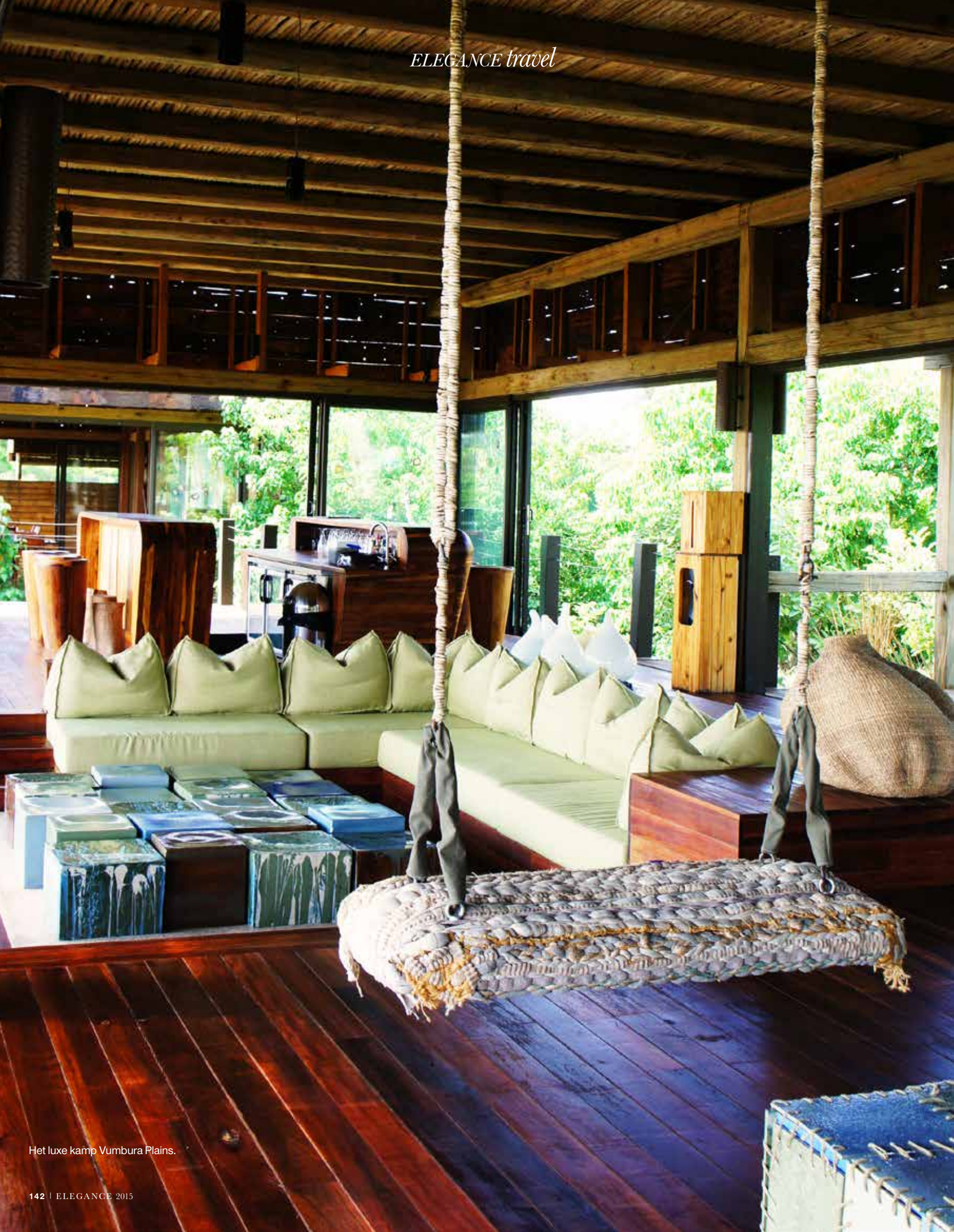
Het luxe kamp Vumbura Plains.