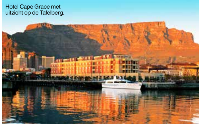
Hotel Cape Grace met uitzicht op de Tafelberg.