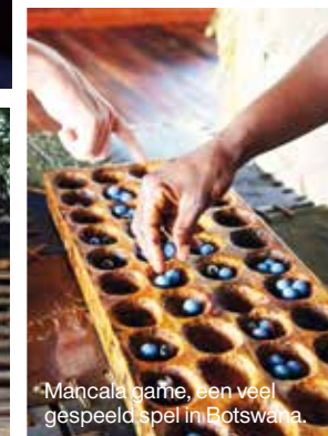
Mancala game, een veel gespeeld spel in Botswana.