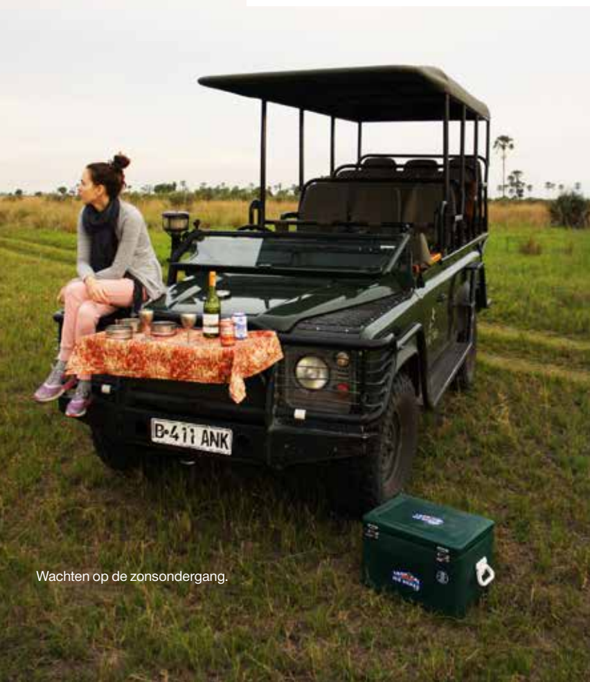
Wachten op de zonsondergang.

Cape Grace is een geweldig boetiekhotel in Kaapstad, met uitzicht op de Tafelberg. Het ligt in Waterfront, een levendige, veilige wijk met veel leuke restaurants en winkels. Tweepersoonskamer vanaf €235 www.capegrace.com Hotel Peermont D'Oreale Grande ligt vlak bij het vliegveld van Johannesburg en heeft 192 elegante kamers, diverse restaurants en een casino. Tweepersoonskamer incl. ontbijt vanaf €300 www.doreale.com