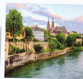
Cruise door vijf landen Cruise van Basel naar Antwerpen.

Kijk op Webscope voor het volledige aanbod.