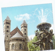
Muziekcruise over de Maas Inclusief ticket voor het concert van André Rieu.

Naast het vaste aanbod van de MS Rigoletto, MS Verdi en MS Carmen heeft Oad in 2018 ook de MS Princess in het aanbod opgenomen. Op de in 2017 volledig gerenoveerde schepen MS Verdi en MS Carmen (beide 4*Deluxe) is een persoonslift aanwezig en beschikken de 2 persoonshutten op het panoramadek over een Frans balkon. De 1 persoonshutten zijn ruim en beschikken over een bed en zitgedeelte. Bovendien worden alle maaltijden vers voor u bereid en geniet u aan boord van alle schepen van uitstekende service en verzorging!