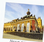
Nieuwe riviercruise Unieke vaarroute over de Elbe van Lübeck naar Berlijn.