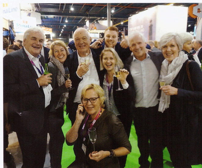
De traditionele champagneborrel bij Sunair werd druk bezocht. De stemming was meer dan goed.