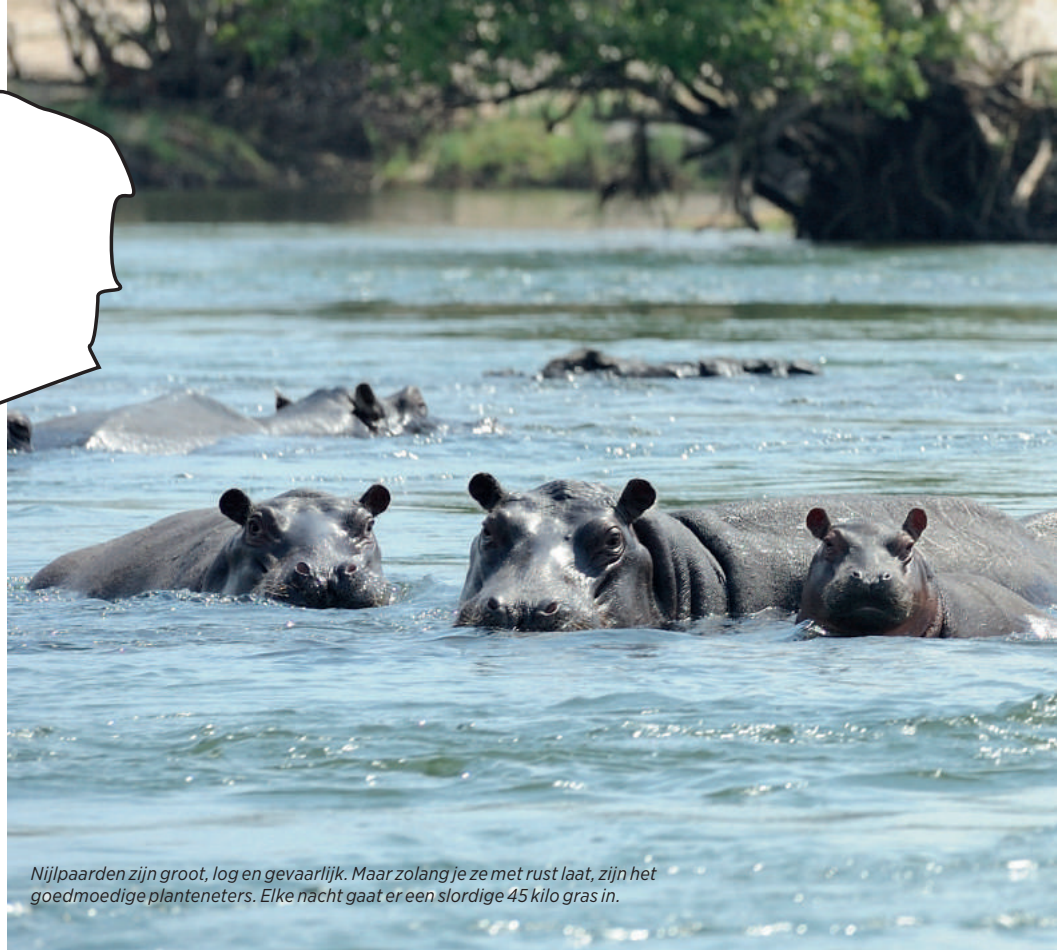
Nijlpaarden zijn groot, log en gevaarlijk. Maar zolang je ze met rust laat, zijn het goedmoedige planteneters. Elke nacht gaat er een slordige 45 kilo gras in.

Ons Afrikaanse avontuur begon vijf dagen geleden na een rechtstreekse vlucht met KLM op het vliegveld van Lusaka en met een binnenlandse vlucht naar Livingstone. Het doel is om zelf te ervaren wat er in de bush van Zambia te beleven is. De beste manier hiervoor is gamedriving, dé activiteit op dit soort plekken: in een open Landrover of Landcruiser het park in, met een zeer ervaren gids en/of chauffeur. Uren achter elkaar, met verrekijker en camera bij de hand. Bij voorkeur 's ochtends heel vroeg of 's avonds tegen de schemering. Dan is het minder warm, het licht is mooier en de dieren zijn actiever.